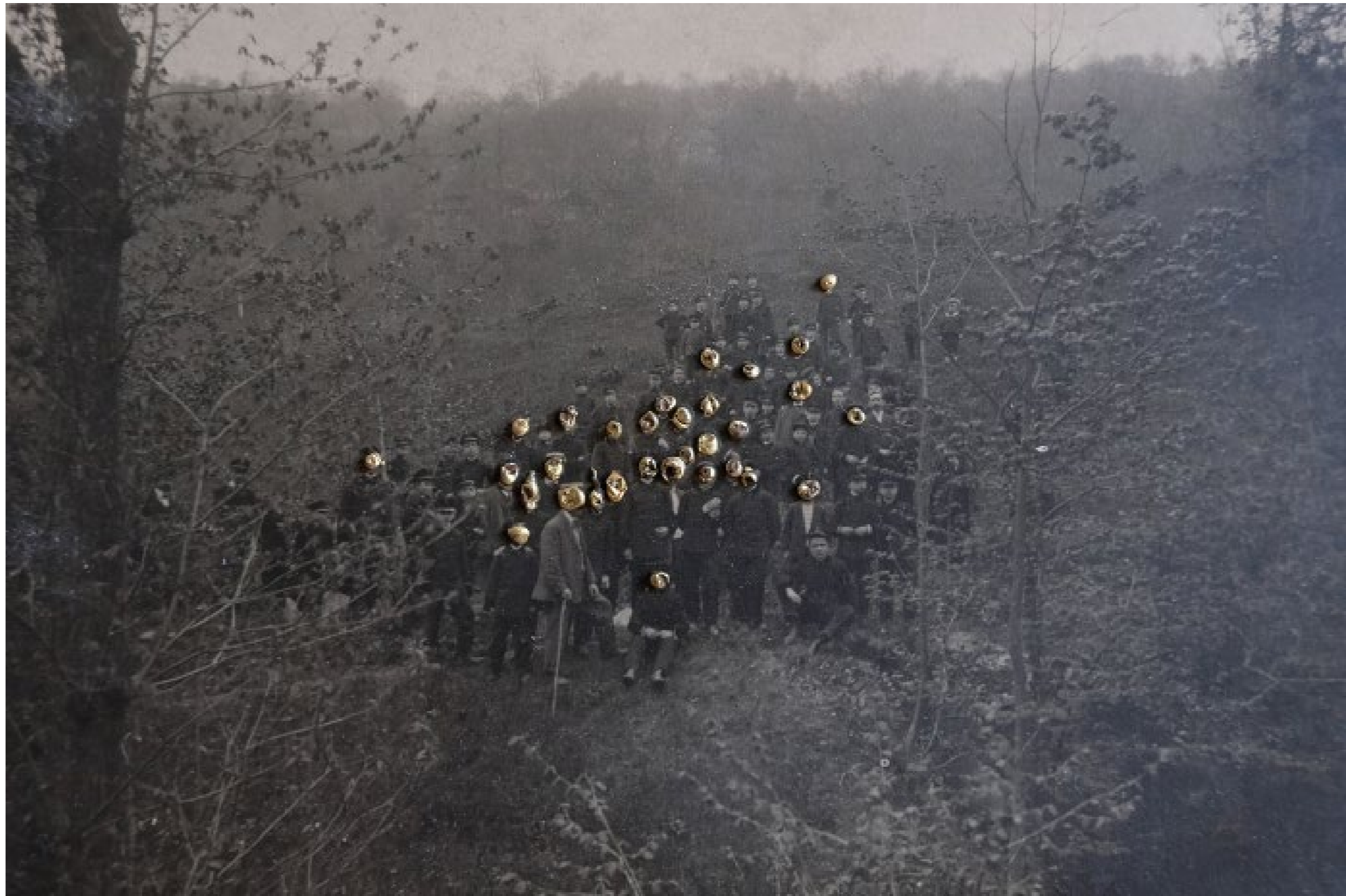
Visita interiora terrae h. 11 cm x 15,5 cm Oro 18 kt su foto d'epoca