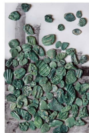
Lo smembramento di Osiride 29 x 301 cm, argilla su carta