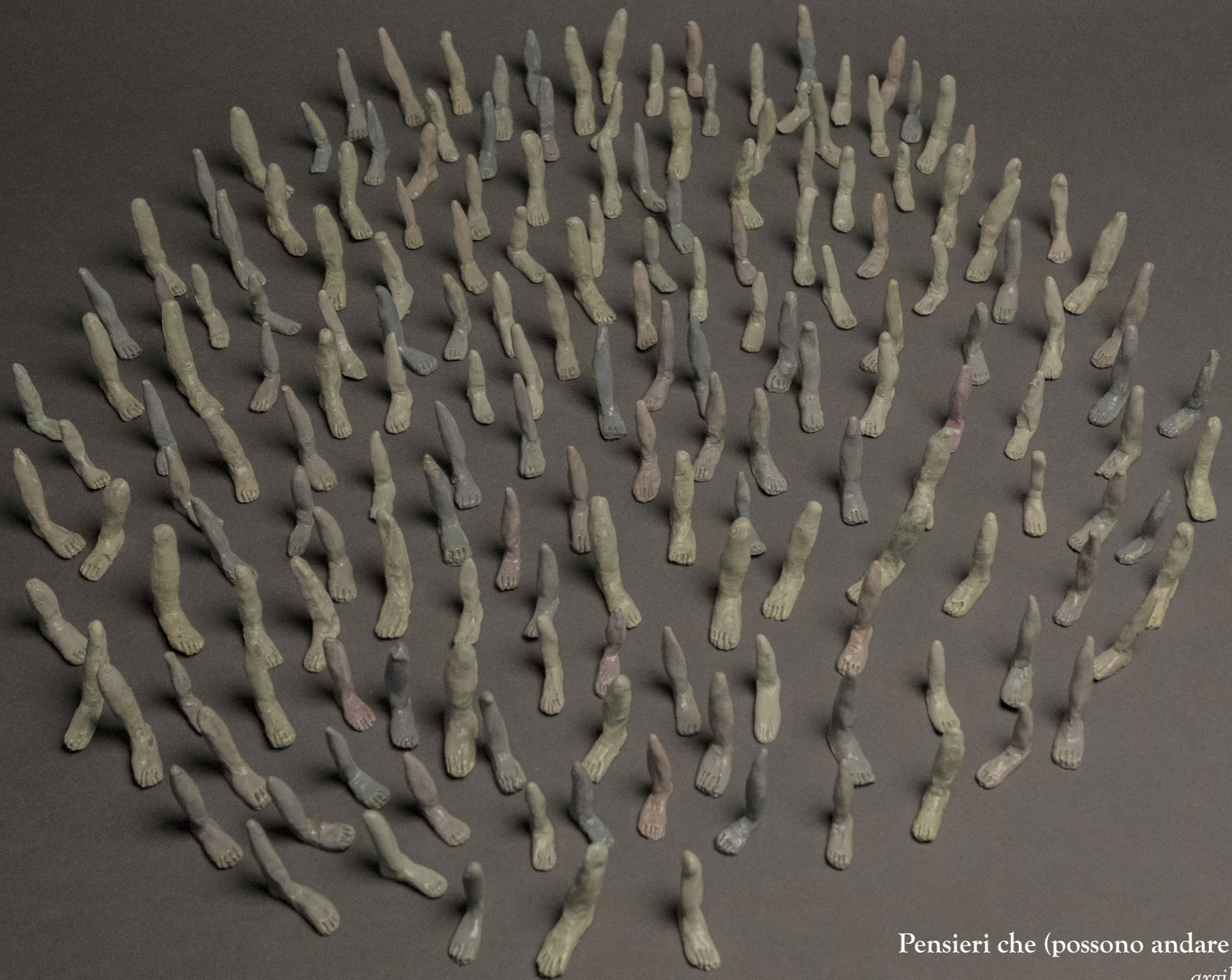
Pensieri che (possono andare e io no) argilla fredda