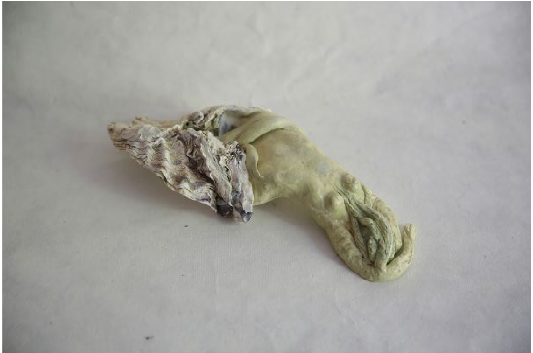
Vestali o la casa delle vergini Argilla e materiali organici