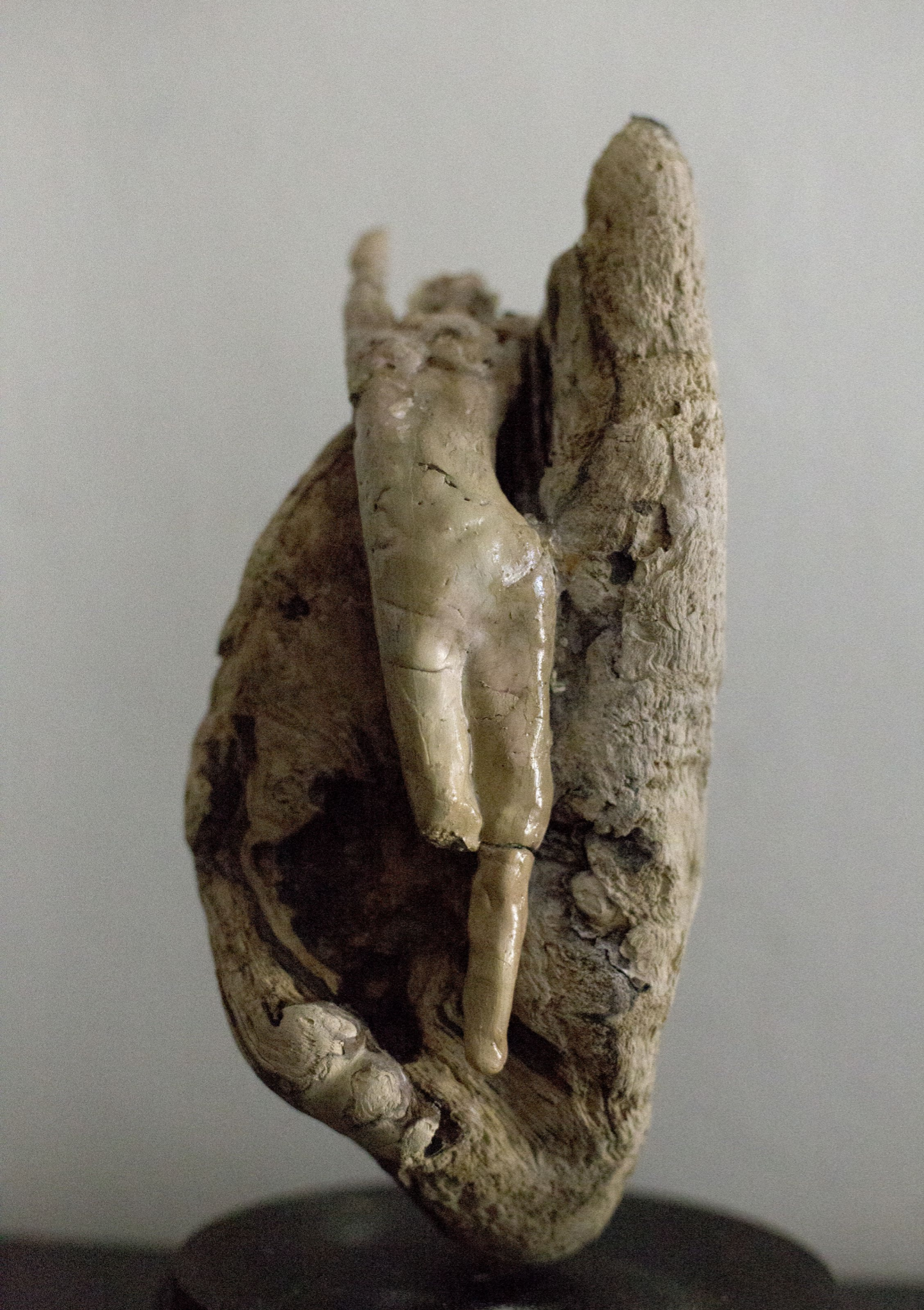
Ragazza rampicante h 25 cm, argilla fredda, quarzi ametiste, elementi organici