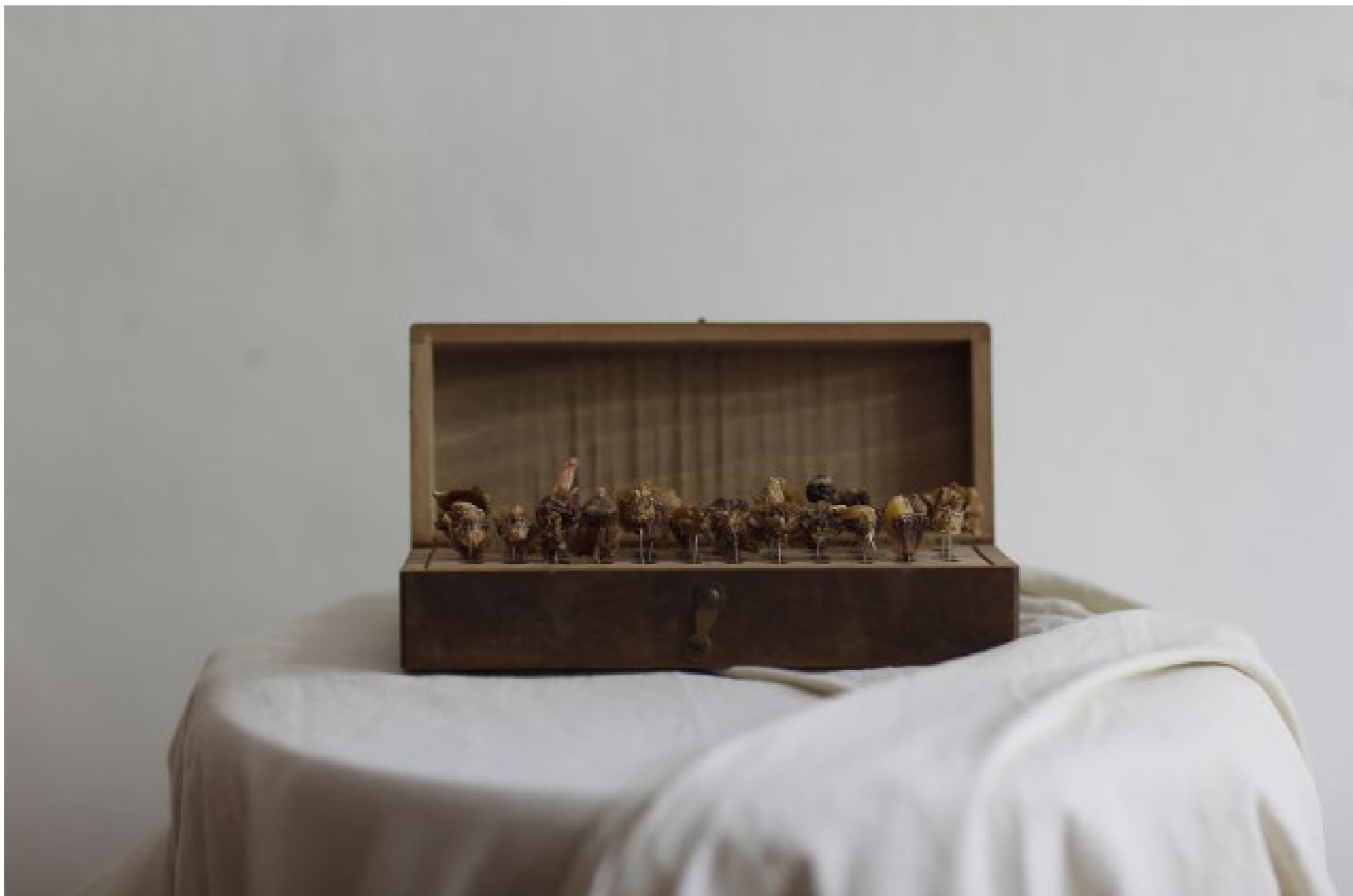
Sacre du printemps (erbario di Proserpina) 9,5 x 17,5 x 9 cm, scatola in legno, elementi organici e cera d'api