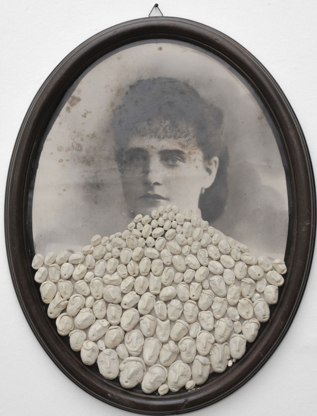
Non so chi siano i miei antenati ma parlano tutti 42 x 33 cm, argilla su foto d'epoca