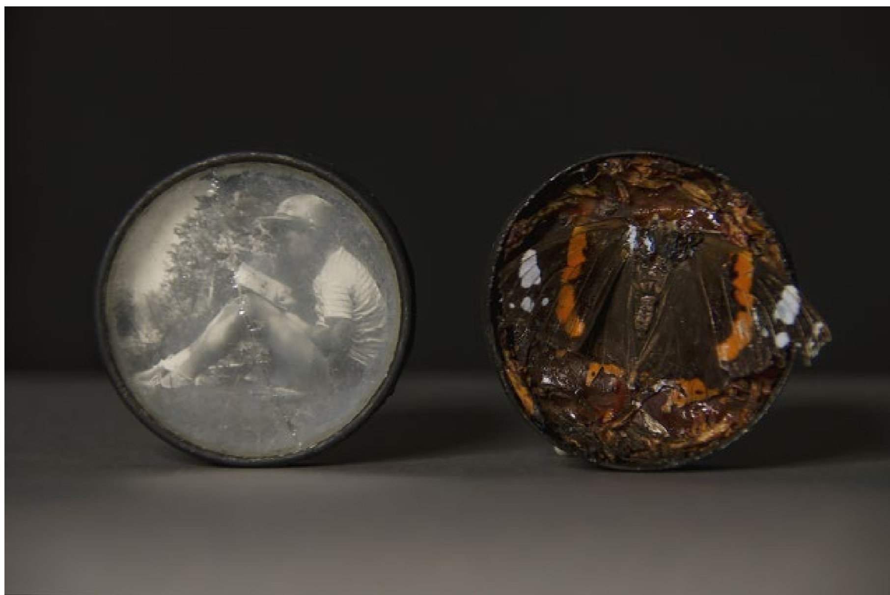
E lo sognavo, e lo sogno 5 cm ø elementi organici, scatola di metallo e foto d'epoca

Le farfalle ridono, come folli /s'intrecciano i girotondi delle care sciocchine / sul groviglio celeste /delle figure stereometriche/ insegna loro tutta questa matematica /un nudo Cupido rosato. Sa di scuola coreografica / di giovane vino carnascialesco / questa baraonda di giugno / delle farfalle che giocano col fuoco/ che mutano di luogo come perline / col proprio alato condottiero. Così ne porta via la ciurma scolaresca / fragile, spensierata, indecisa / il vento che irrompe violento nella vita. (Arsenij Tarkovskij)