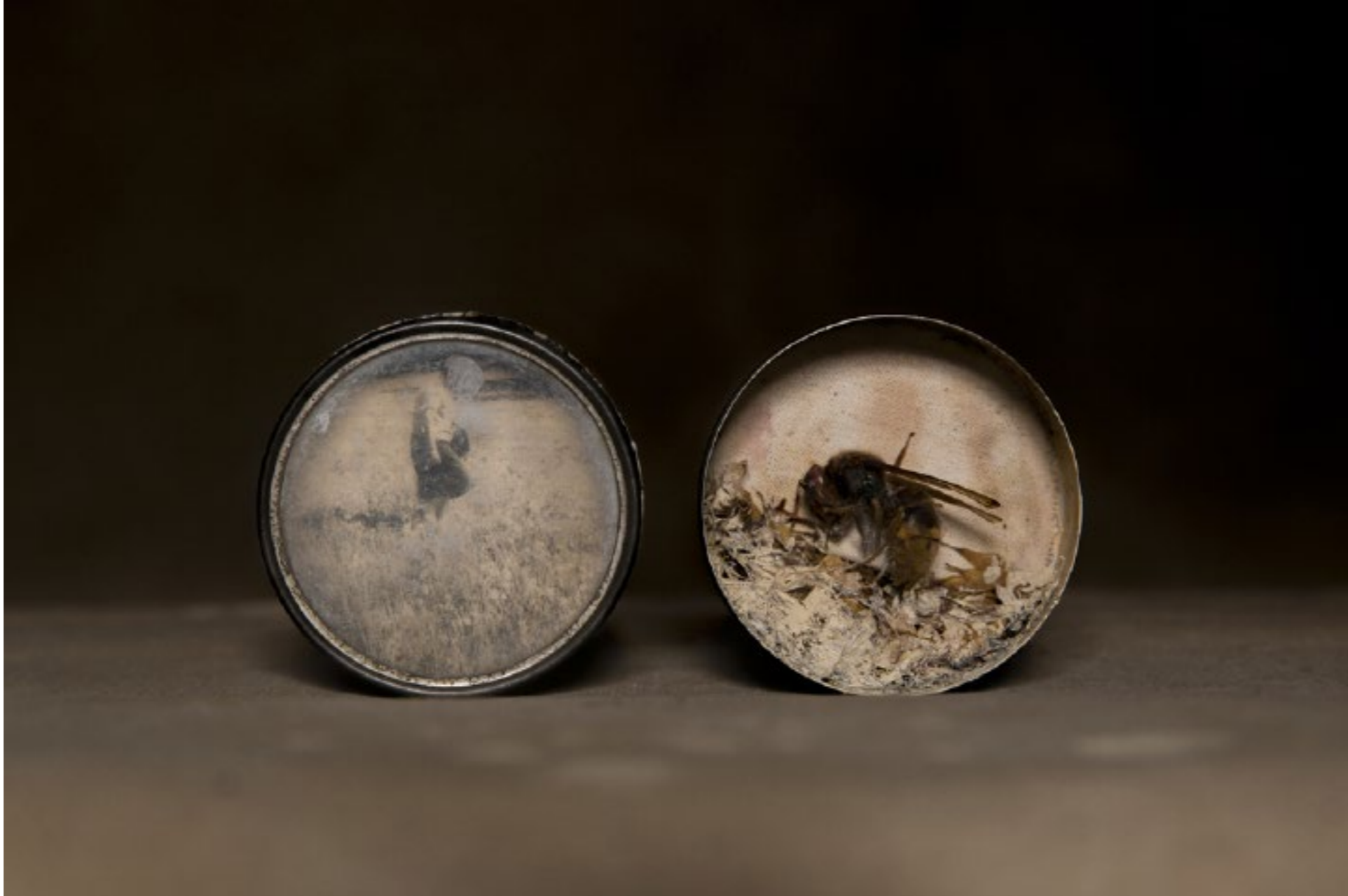
The ecstasy of (everything) gold 5 cm ø materiali organici, scatola di metallo, foto d'epoca