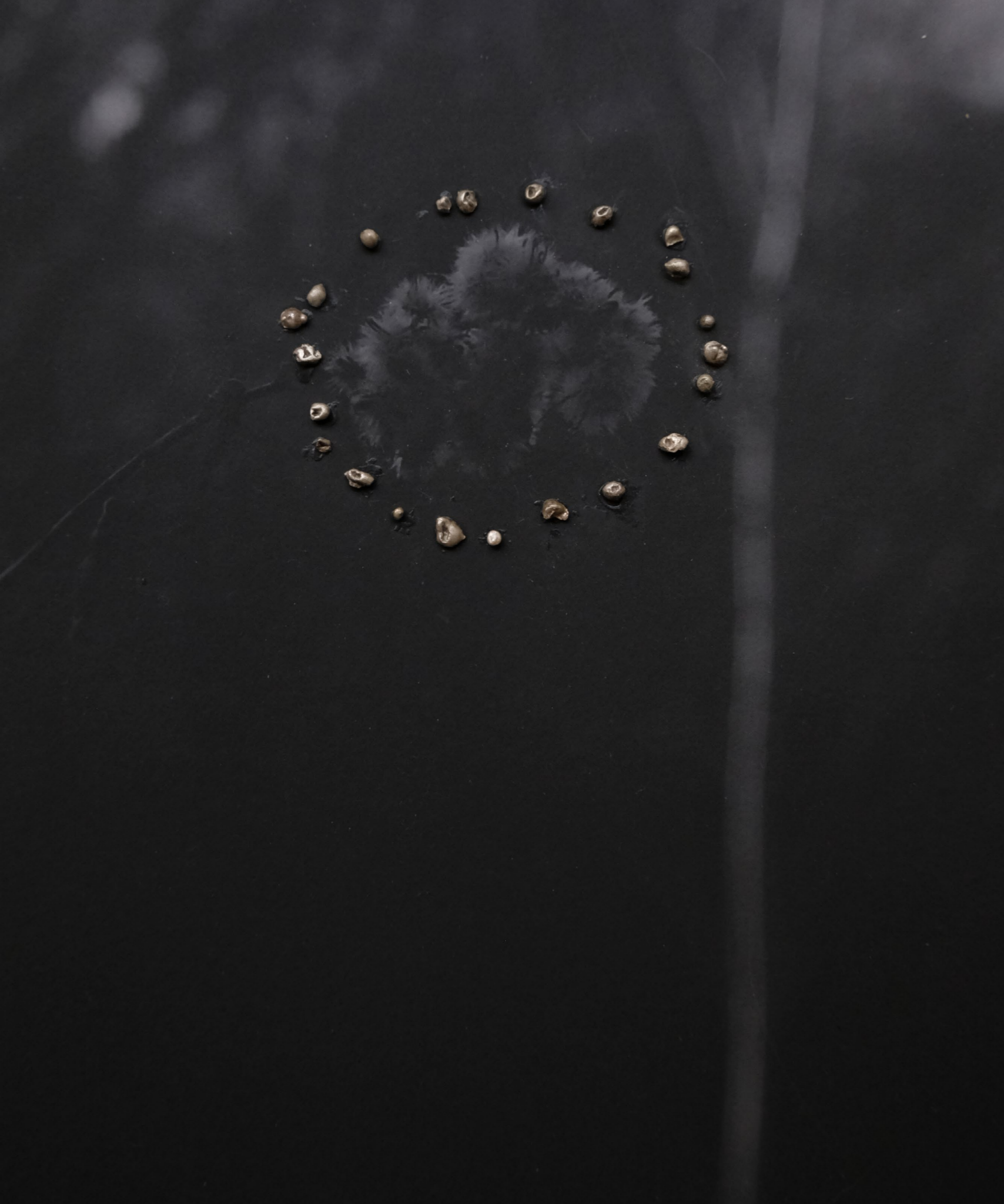
Fuochi di Ishtar 21 x 15 cm Argento 925 su foto